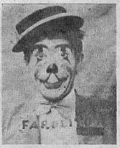
Emperador de la risa

Ya inició su brillante temporada en la Plaza González Víquez